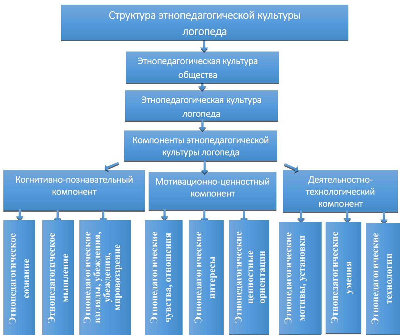
Схема 1. Структура этнопедагогической культуры логопеда

В главе 2 «Система педагогического обеспечения формирования этнопедагогической культуры логопеда» изложены результаты анализа логопедического потенциала этнопедагогических источников, представлены основания системы педагогического обеспечения формирования этнопедагогической культуры логопеда: структурно-функциональная модель данного процесса, комплексная программ ее формирования, созданная на основе структурно-функциональной модели, педагогические условия эффективной реализации программы, описаны результаты опытно-экспериментальной работы по проверке ее результативности.