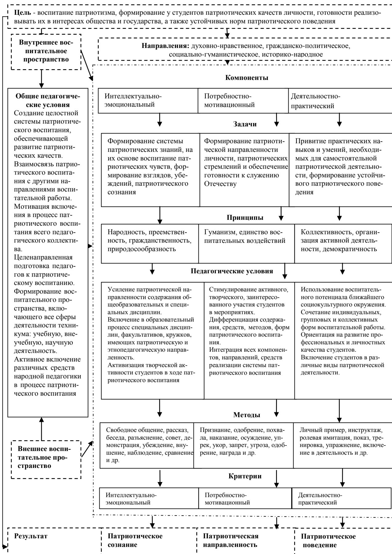
Рис. 2. Теоретическая модель патриотического воспитания