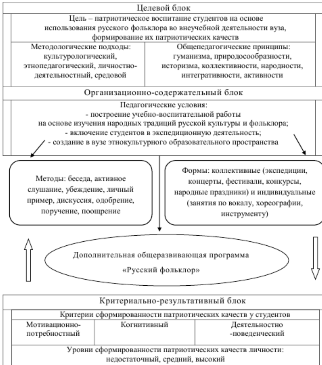
Рис. 1. Модель патриотического воспитания студентов на основе использования русского фольклора во внеучебной деятельности вуза

Для оценивания уровня сформированности патриотических качеств обучающихся на основе использования русского фольклора во внеучебной деятельности были разработаны критерии и определены соответствующие им показатели. В состав мотивационно-потребностного критерия входят эмоционально-положительное отношение к фольклорным произведениям; желание приобщаться к народным традициям русской культуры; стремление находиться в фольклорном коллективе. В качестве основных показателей когнитивного критерия мы обозначили знание основ русской традиционной народной культуры, региональных этнокультурных традиций; владение умениями и навыками в области фольклорного исполнительства; понимание сущности патриотизма. Деятельностно-поведенческий критерий включает в себя проявление товарищества и единения в процессе фольклорной коллективной деятельности; владение способами и действиями проведения этнокультурных мероприятий.