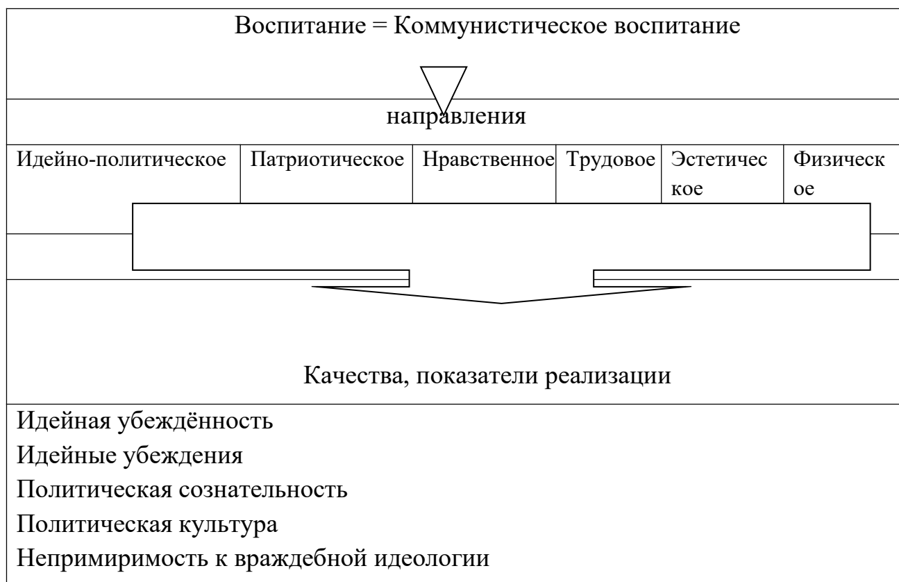
Схема структуры теории коммунистического воспитания.