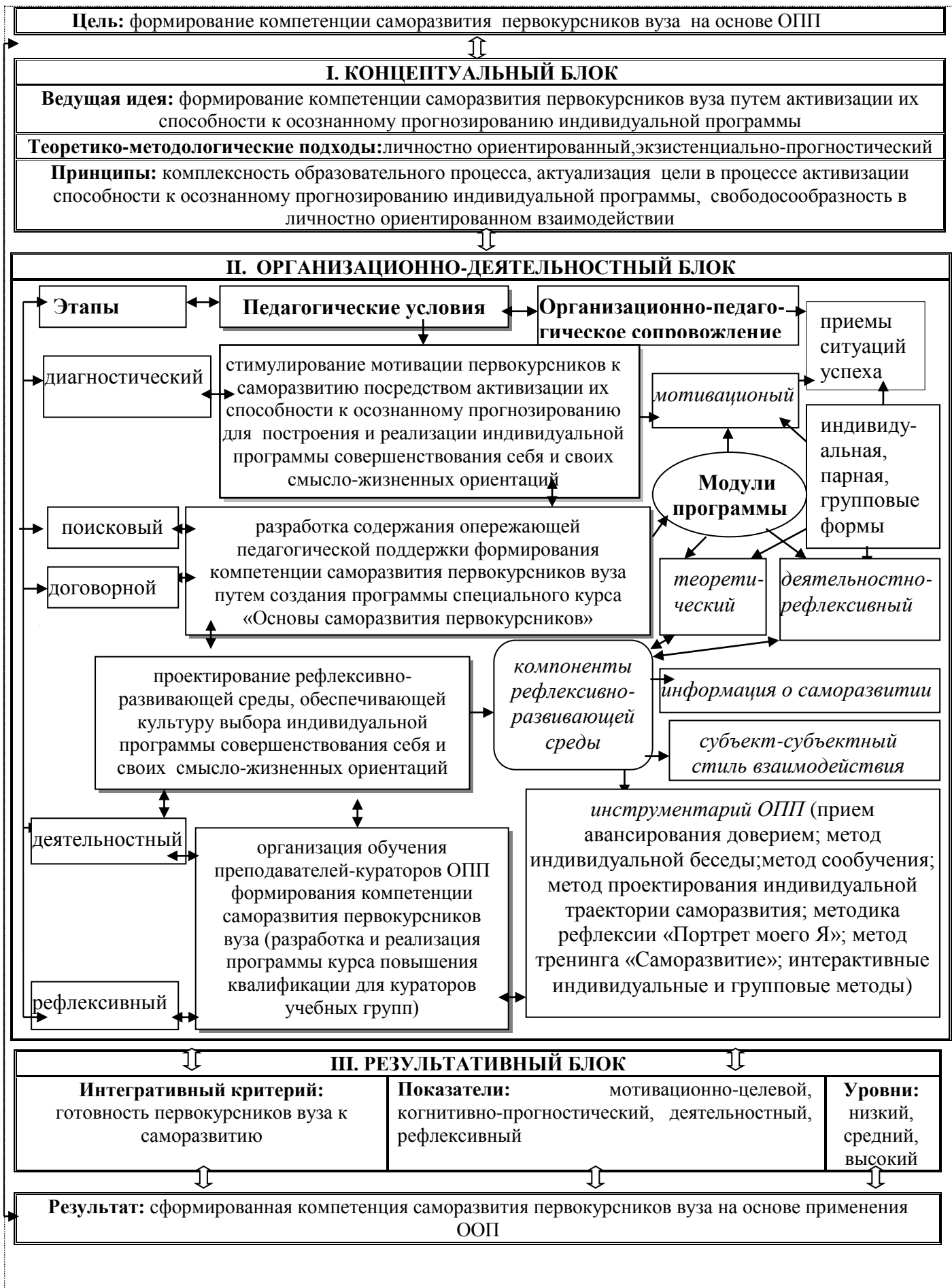
Рис. 1. Модель опережающей педагогической поддержки формирования компетенции саморазвития первокурсников вуза