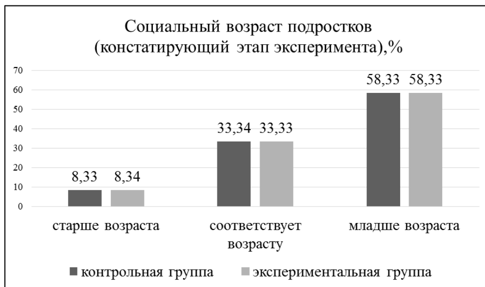
Диаграмма 2. Социальный возраст подростков (констатирующий этап эксперимента)

При анализе данных, полученных в контрольной группе, мы отмечаем, что только 5 человек (10,4 % от всех мальчиков) соответствуют норме по социализированности. Это выше на 2,1 %, чем в экспериментальной группе. Однако количество отстающих от нормы мальчишек больше – 43 человека (89,6 %). Если проанализировать данные по всей этой группе, то школьников, соответствующих по уровню социализированности своему возрасту, – 40 человек (33,35 %), превышающих на год – 10 девочек (8,25 %), отстающих на год – 70 человек (58,34 %). Это явление отражено на диаграмме 2.