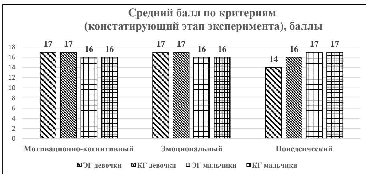
Диаграмма 1. Средний балл по критериям (констатирующий этап эксперимента)

На диаграмме 1 «Средний балл по критериям (констатирующий этап эксперимента)» отражено, что у мальчиков ниже нормы показатели мотивационно-когнитивные и эмоциональные, а у девочек – поведенческие. Причем в экспериментальной группе выше средний балл (14), чем в контрольной группе (16). Мы предположили, что потребность проявить себя в обществе посредством принятия поведенческих решений явилось предпосылкой для записи в ТКО.