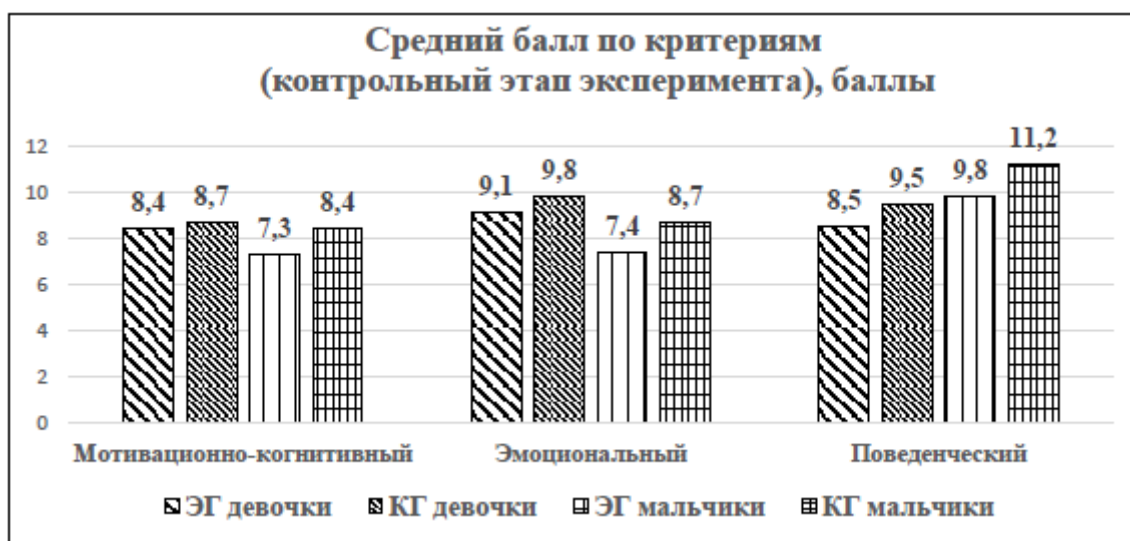
Диаграмма 3. Средний балл по критериям (контрольный этап эксперимента)

Видно из диаграммы 3, что в контрольной группе несмотря на наличие ребят, превышающих СНП, наблюдается снижение по сравнению с экспериментальной группой по всему критериальному ряду. Все показатели контрольной группы больше, чем у экспериментальной, что подтверждает успешность педагогического сопровождения в условиях ТКО.