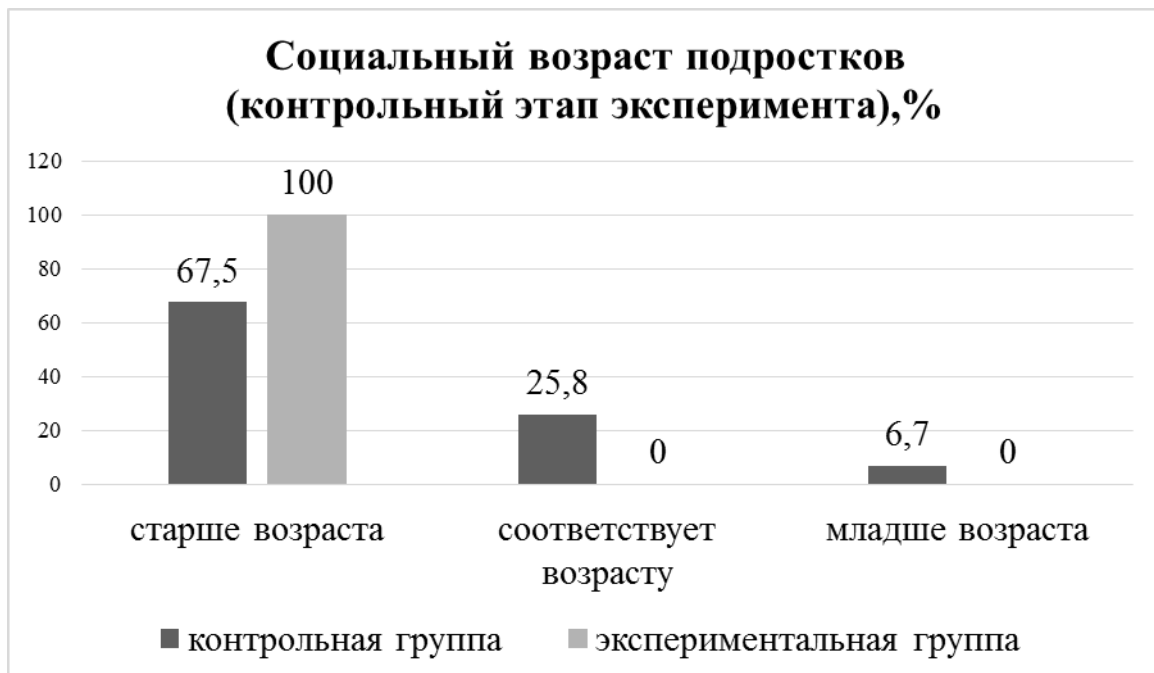
Диаграмма 4. Социальный возраст подростков (контрольный этап эксперимента)

Средние показатели социального возраста подростков мы сравнили с хронологическим возрастом, и результаты оформили в виде диаграммы 4 «Социальный возраст подростков (контрольный этап эксперимента)».