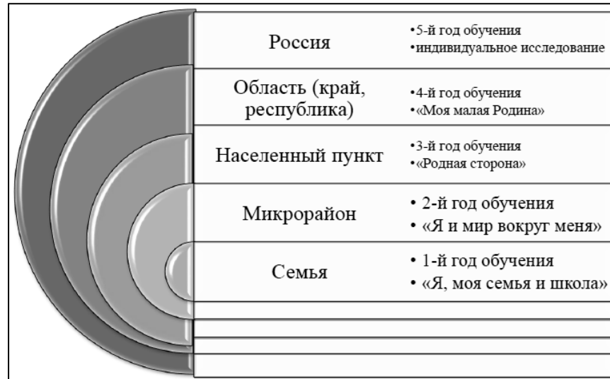
Рис. 4 Логика включения подростка в систему общественных отношений по программе «Активисты школьного музея»

По программе «Активисты школьного музея» обучающийся входил в систему общественных отношений постепенно, начиная с ближайшего окружения. Это выражено в виде схемы на рис. 4 «Логика включения подростка в систему общественных отношений по программе "Активисты школьного музея"».